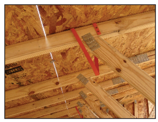
Sistema de anclaje instalado de antemano en un ático.

Contemple la posibilidad de dejar los anclajes instalados: Si resulta práctico, los empleadores deben contemplar la posibilidad de dejar los anclajes instalados, lo cual facilitará el trabajo en curso y reducirá la carga de los techadores posteriores.