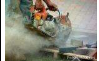
d. Polvo de sílice

4. Durante la tarea del corte/ pulido de materiales como el concreto, losetas y bloques, ¿Cuáles es el efecto mas severo a la salud para los trabajadores?