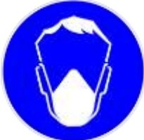
b. protección respiratoria