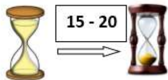
a. Crónica (15–20 años)