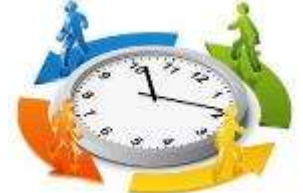
d. rotar trabajadores

6. Según la norma de OSHA, ¿con qué frecuencia se deben repetir las pruebas médicas a un trabajador expuesto a sílice (silica)?