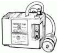
a. determinar exposición

5. Para cualquier actividad donde haya exposición a polvo de sílice por encima del nivel de acción, (25ug/m3) OSHA requiere como primera opción para controlar exposición: