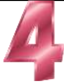
b. Cuatro años