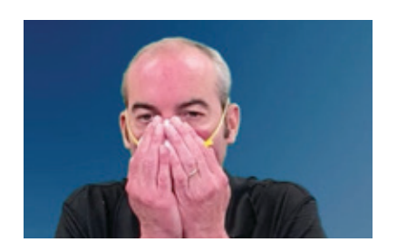
Plase tou de men ou sou respiratè a. Rale souf ou byen vit epi lage souf ou. Si ou santi souf ou kite respiratè a vit, ajiste pati ki nan nen w lan; si sa fèt arebò respiratè a, reajiste fil yo.