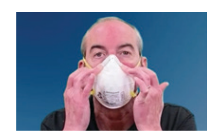
Si resipratè ou a gen yon klip metal nan nen an, itilize pwent dwèt ou yo ak tou de men ou pou ou ka fè zòn nen an pran fòm nen pa ou.