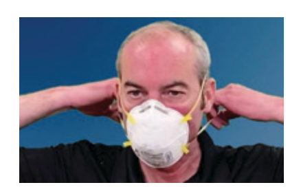
Retire respiratè a pa dèyè. Pa manyen devan an.