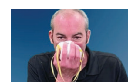
Kouvri bouch ou ak nen ou avèk respiratè a, epi asire w pa genyen okenn espas (tankou bab, cheve, ak linèt) ant figi ou ak respiratè a.