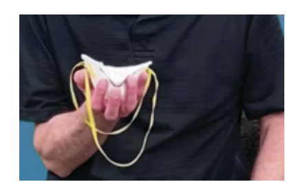
Mete respiratè a nan men ou epi kenbe pati kap kouvri nen ou an avèk pwent dwèt ou epi fil yo ap pandye anba men ou.