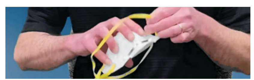
Verifye ke respiratè a pa domaje. Si li sanble domaje oswa mouye, pa itilize li.