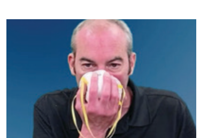
用面罩覆盖口鼻并确保 隙(如,胡须、头发以 及眼镜)。