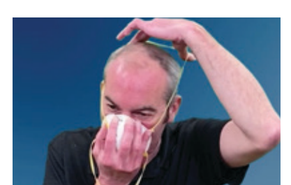
将松紧带拉到头部后 方,固定在偏上部分。 若有第二条松紧带,将 皮鼻夹区域,使其贴合 底部的松紧带固定到耳 朵下方脖颈处。请勿交 叉松紧带。