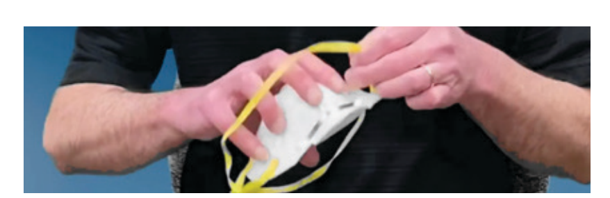
检查面罩是否有破损。若面罩破损或潮湿, 请勿 使用。