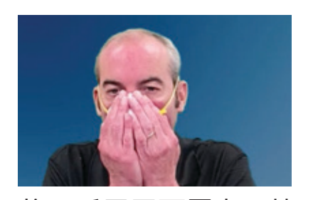
将双手置于面罩上。快 速吸气, 然后呼气。若 感到鼻部有漏气, 调整 鼻夹;若面罩边缘有漏 气,调整松紧带。