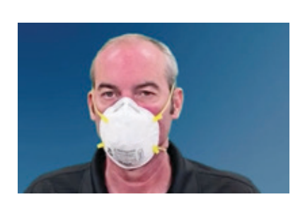
避免在使用时触摸面 罩。若触摸了面罩,请 洗手。

注意: 若需重复使用 呼吸面罩, 佩戴手套 来进行面罩检查与佩 戴。使用过程中避免 触摸面部(包括眼睛 与口鼻)。