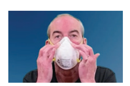
若您的面罩带有金属 鼻夹,用双手指尖按压 鼻部。