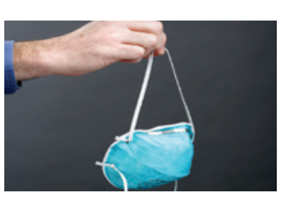
若无需因供给不足而重复 使用呼吸面罩,请将其弃置 于封闭的废物容器中。洗手。